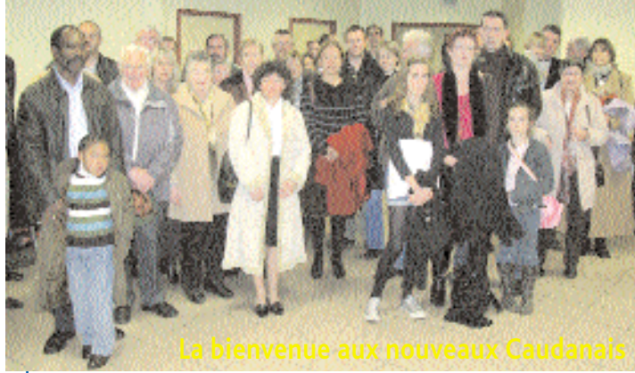
La bienvenue aux nouveaux Caudanais

Pour la dixième année consécutive, la municipalité a reçu les familles nouvellement installées à Caudan. Vendredi 5 décembre, une