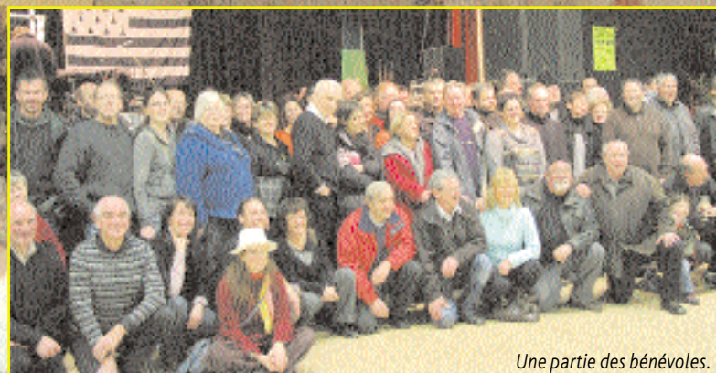
Une partie des bénévoles.