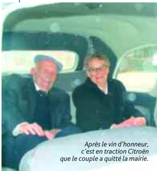
Après le vin d'honneur, c'est en traction Citroën que le couple a quitté la mairie.