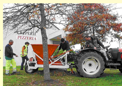
Plantation de bulbes au printemps

Le recensement des zones humides, dans le cadre de la charte pour l'environnement et le développement durable de Cap l'Orient, a été effectué de mars à octobre 2007. La commission était composée d'élus, de représentants d'agriculteurs et de chasseurs, et de l'ADEC (association de défense de l'environnement de Caudan). Les zones humides représentent 8% de l'ensemble du territoire, soit 350 ha composés de 2/3 de bois et prairies.