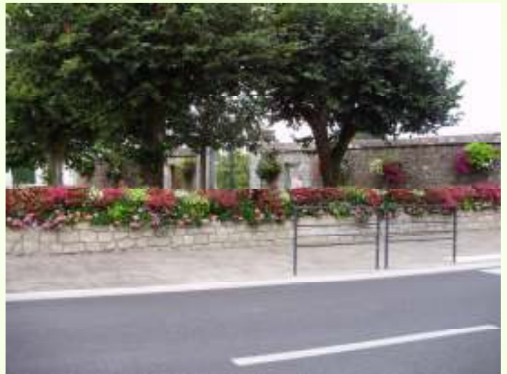
L'entrée du cimetière