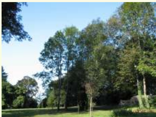
Le parc du château du Diable

Dans le cadre de la politique d'économie d'eau le service des espaces verts utilise des systèmes économes du type goutte-à-goutte, arrosage intégré et développe l'installation de plantes vivaces ne nécessitant pas d'arrosage. Les trois terrains de football sont équipés du système d'arrosage intégré. L'apport d'eau quand il est nécessaire se fait en utilisant les eaux de recyclage de