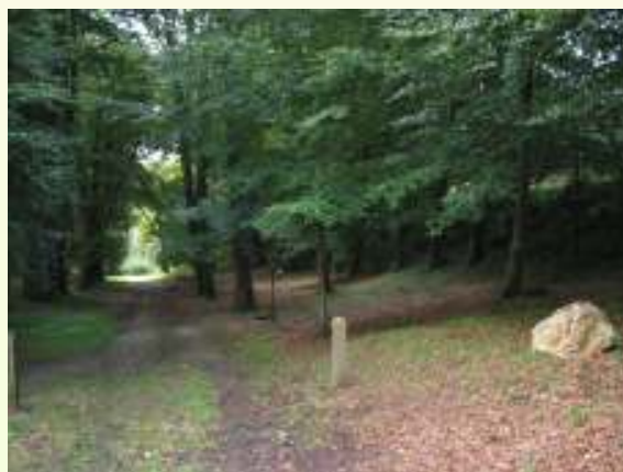
Le bois de Pont-Youan