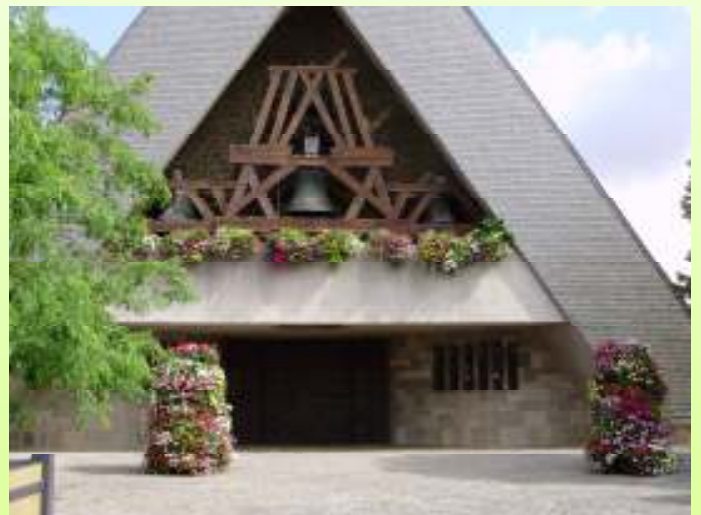
Le parvis de l'Eglise