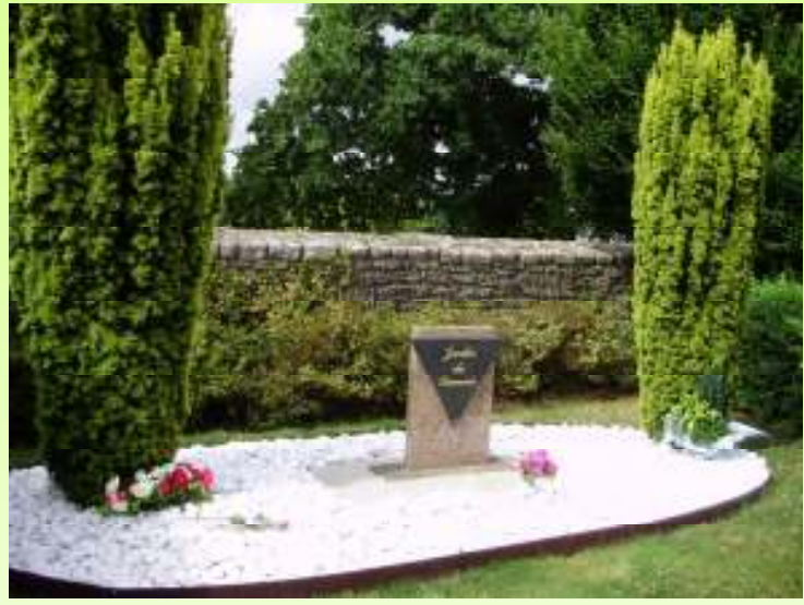
Le jardin du souvenir